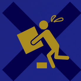
転倒災害防止部門