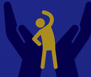
エイジフレンドリー部門

労働災害防止に向けた取組を実施している企業・団体に取組内容を応募いただき、優れた取組を部門別に表彰いたします。