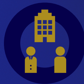
企業等間連携部門